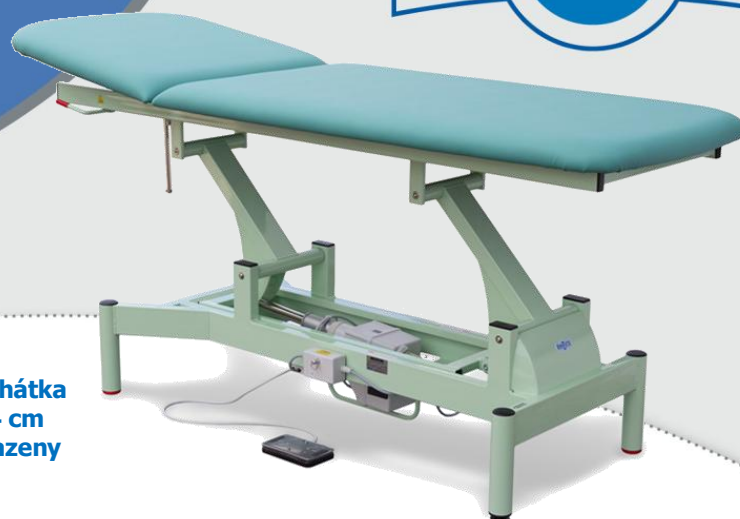
Ilustrační obrázek lehátka s podhlavníkem 64 cm (další varianty zobrazeny na straně 4)