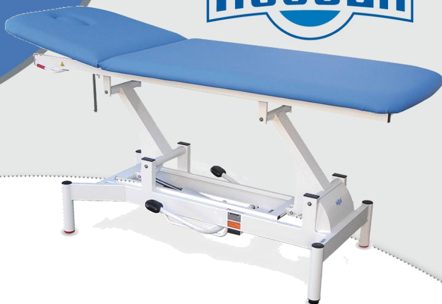
Ilustrační obrázek lehátka s podhlavníkem 64 cm (další varianty zobrazeny na straně 4)